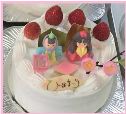
花月堂松尾製菓 3,600円