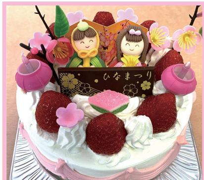
サルタセカンド 4,300円

道産の卵、生クリームを使用した可愛いらしいお雛様ケーキ、黄桃を生クリームにサンドしてます。